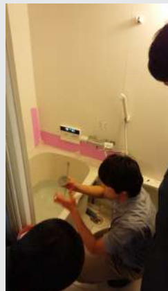
東京での研修を受けました