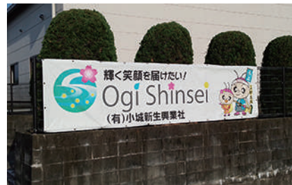
会社の裏に横断幕も設置しました

「皆様に愛される会社づくり」を目指して、社員一同取り組んでまいりますので、今後ともよろしくお願ひ致します。