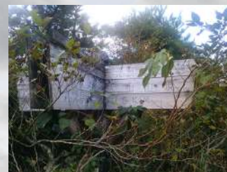
分かれ道には看板