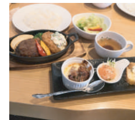
バラエティー豊富 (* `▽` *) MISATO ランチ 1,320円