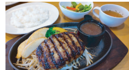
柔らかくてジューシー♪ ハンバーグランチ 968円