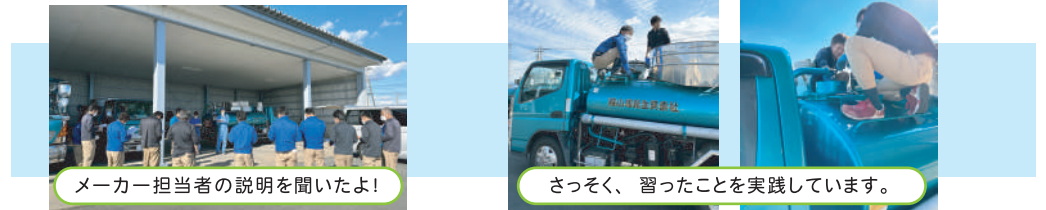
メーカー担当者の説明を聞いたよ!