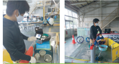
技術とともにちょっとしたコツも教えてもらいました。